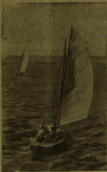
Сезон парусного спорта открылся на Клязьминском водохранилище. На снимке: яхты на тренировке.